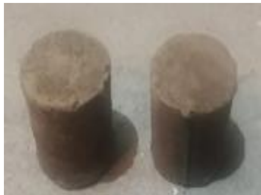
Figura 2. Probetas para ensayo de compresión.

El material arcilloso, se amasa con un 5 % en peso de agua para su conformado y se dejó reposar durante 72 horas en bolsas herméticas; con el cual se elaboraron probeta cilíndrica de 40 mm de diámetro y 40 mm de altura, cumpliendo con lo recomendado por [11]; figura 2.