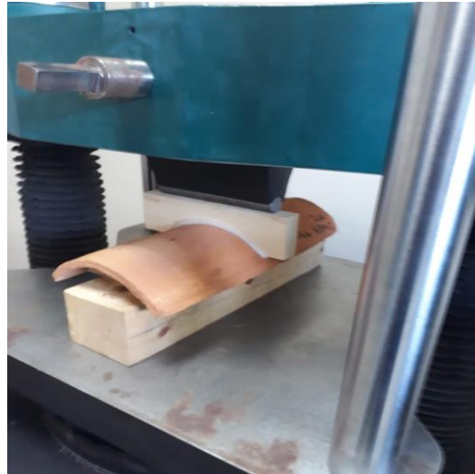
Figura 3. Prensa universal Tinius Olsen.

Para la realización de los ensayos se utilizó la Prensa Hidráulica de la marca Tinius Olsen Máquina de prueba universal hidráulica Super "L".