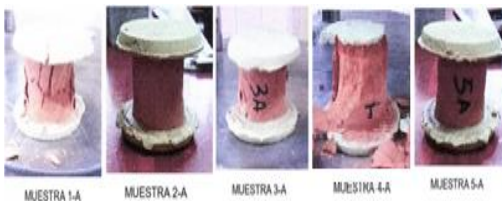
Figura 4. Pruebas a compresión, El Tingo.

En el proceso de experimentación, se observaron fisuras verticales columnar, a través de ambos extremos, conos no muy definidos, en todos los casos (figura 4).