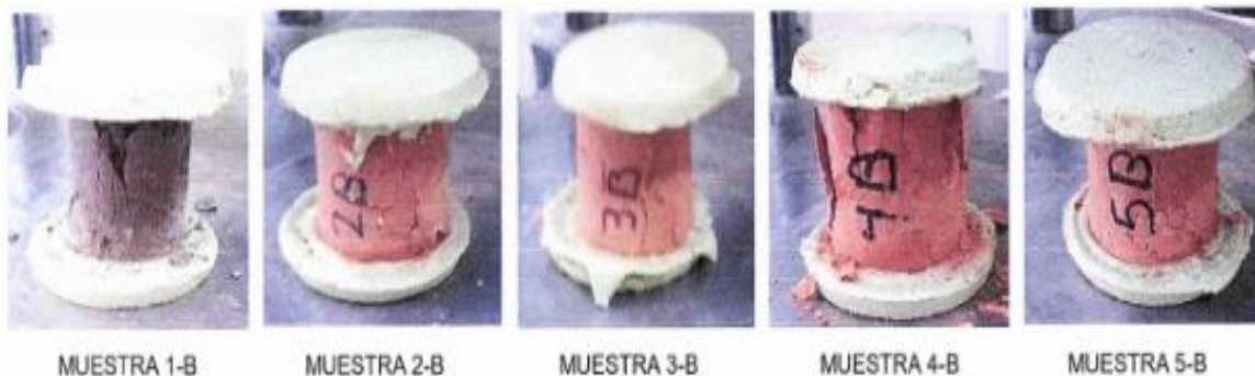
Figura 5. Pruebas a compresión, La Victoria.

En este caso, durante el proceso de experimentación, se observaron fisuras verticales columnar a través de ambos extremos y conos no muy definidos en todos los casos (figura 5).